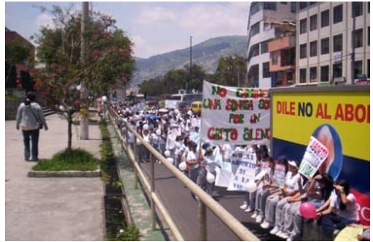
Vista de una de las muchas marchas por la vida que se organizaron en todo el país.

Nuestra afiliada en el Ecuador está a solamente un paso de eliminar dos de los cuatro proyectos de la “cultura” de la muerte, ya que archivados los dos proyectos de despenalización del aborto, quedarían pendientes los anteproyectos de ley de Salud Sexual y Reproductiva y la reforma al nuevo código de salud del Ministerio de Salud.